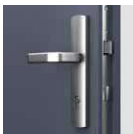
Dvere Steel SAFE Typ III viacbodový hákový zámok