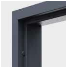
zárubňa ocelová, rohová veľká