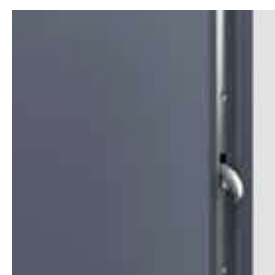
Dvere Steel SAFE Typ III Hák - zamykanie horné/dolné