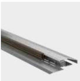
prah z nehrdzavejúcej ocele (perforovaný)