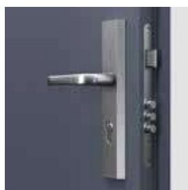
Dvere Steel SAFE Typ II dolný zámok - trojprvkový