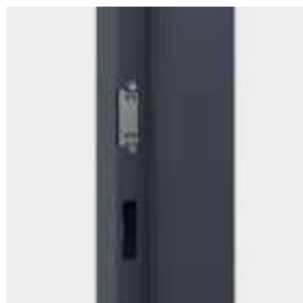
nastaviteľný protiplech zámku