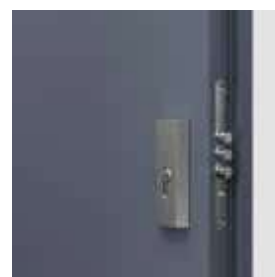
Dvere Steel SAFE Typ II horný zámok - trojprvkový