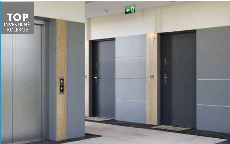
Steel SAFE, A.0 s priezorníkm, Antracit