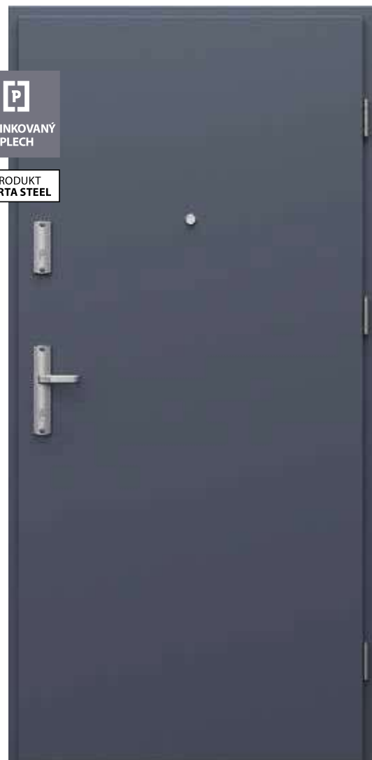
Steel SAFE, A.0 s priezorníkm, Antracit