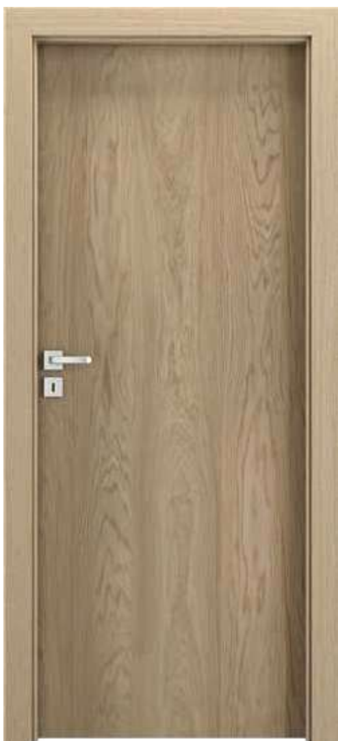
Natura CLASSIC 1.1, Dub 1, vzor dýhy - kvet