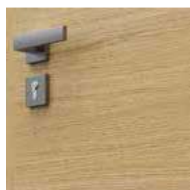
vodorovná štruktúra dreva modely skupiny 7

Špecifikom prírodnej dýhy je možnosť výskytu rozdielov v textúre aj farbe. Tieto rozdiely nemôžu byť dôvodom pre reklamáciu.