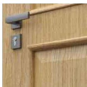
elegantný rám modely skupiny 5