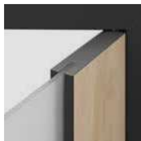
spojenie cez sklo