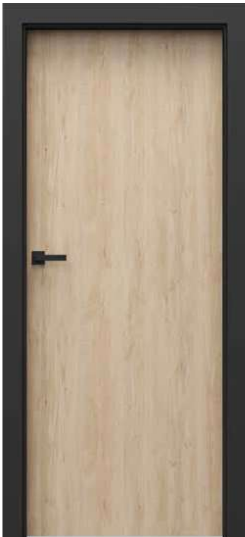
Porta LOFT 1.1, Buk Škandinávsky