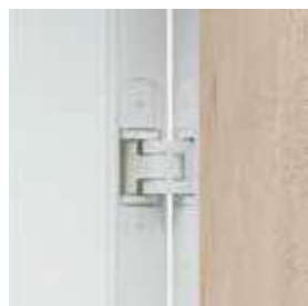
3D pánty vo farbe zárubne