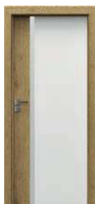
model 4.A so sklom