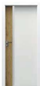
model 4.A so sklom