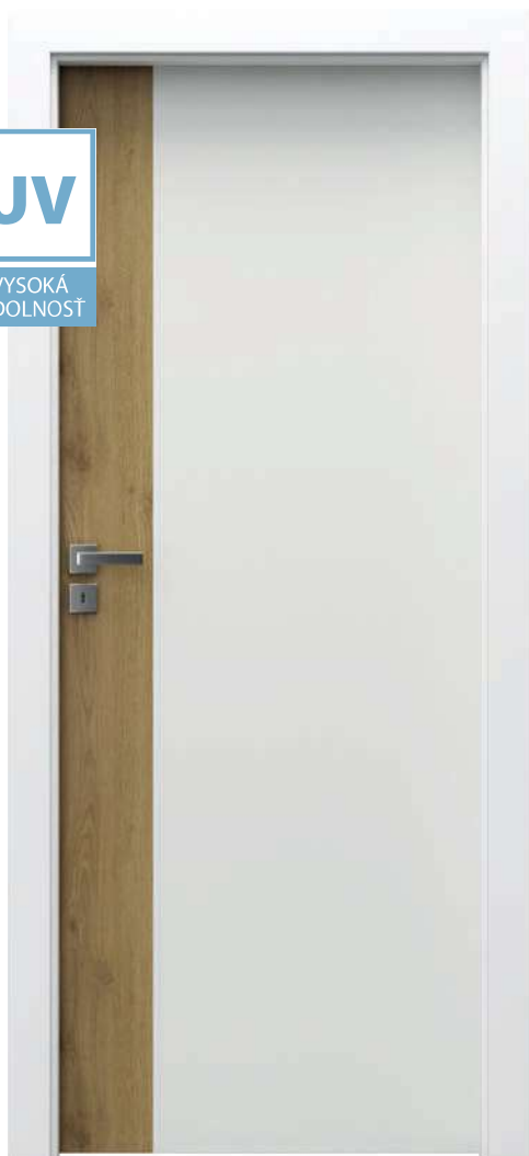
Porta DUO 4.0, Biela Lak UV s Dubom Naturálnym