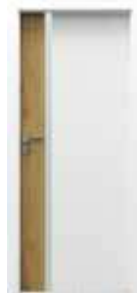
model 4.A so sklom