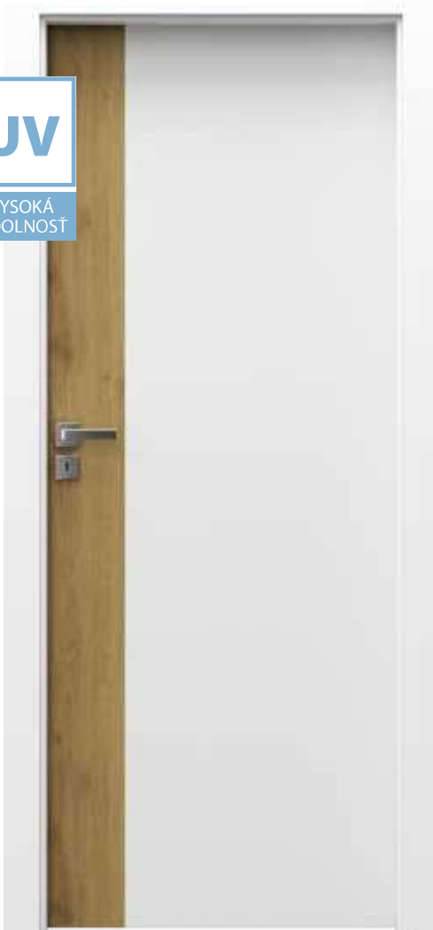
Porta DUO 4.0, Biela Lak UV s Dubom Naturálnym