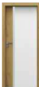
model 4.A so sklom